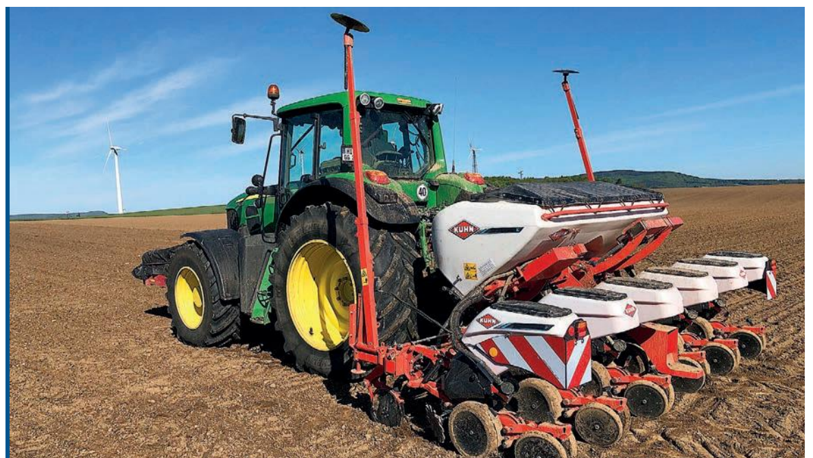
73% des 226 semoirs des Cuma du Grand Est sont des six rangs.

Le parc de semoirs maïs est à 60% composé de Monosem, qui domine ce marché depuis longtemps. L'âge moyen est de plus de 8 ans, preuve de la durabilité d'un semoir. La seconde marque présente dans nos Cuma est Kuhn (20% du parc) mais plutôt en recul, puisque seulement 17% des machines ont moins de 3 ans. La